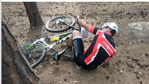
Aby byla sezóna MTBO bez pádů...