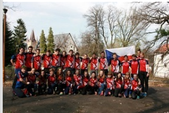
Česká výprava na CEYOC 2017, který se uskutečnil v Polsku.